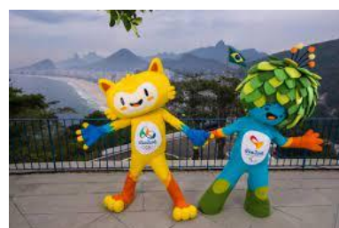
( ___ ) VINICIUS E TOM