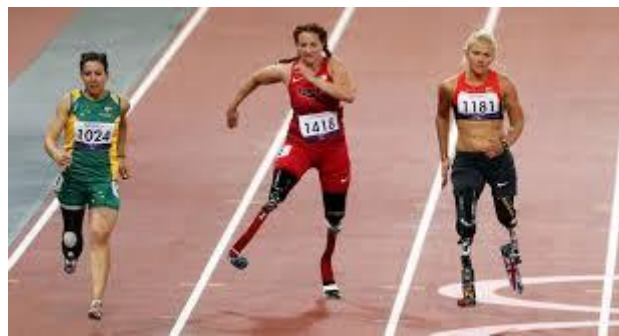
( ___ ) CORRIDA PARA AMPUTADOS

7 - QUAIS SÃO OS MASCOTES DAS OLIMPÍADAS DE TÓQUIO 2020?