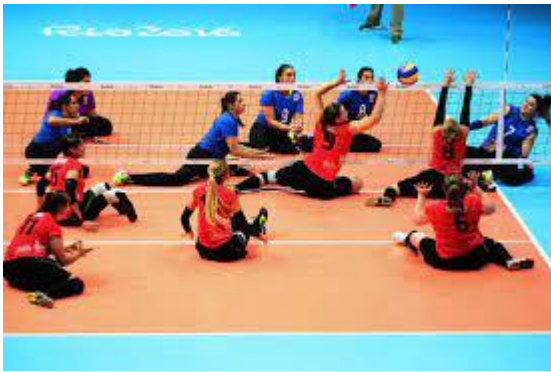
( ___ ) VÔLEI SENTADO

6 - MARQUE A OPÇÃO QUE NÃO REPRESENTA UMA MODALIDADE PARAOLÍMPICA.