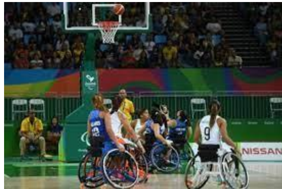
( ___ ) BASQUETE DE CADEIRAS DE RODAS