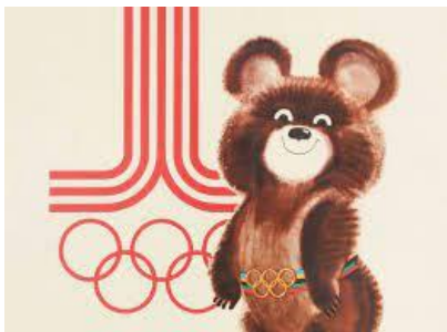
( ___ ) MISHA

7 - QUAIS SÃO OS MASCOTES DAS OLIMPÍADAS DE TÓQUIO 2020?