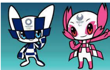
( ___ ) MIRAITOWA E SOMEITY