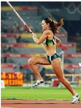
( ___ ) SALTO COM VARA